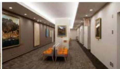
人間ドック待合室