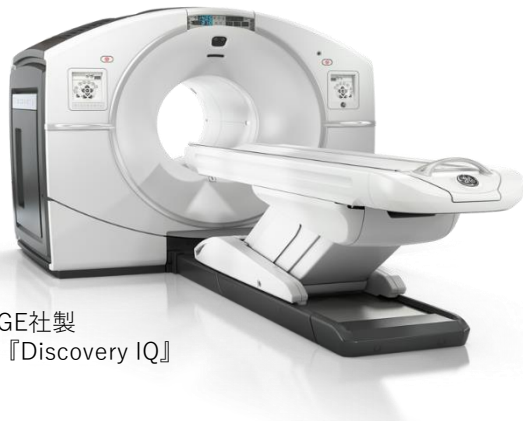
GE社製 『Discovery IQ』

この検査では、すべての認知症を検出するものではありません。血管性認知症や前頭側頭葉変性症が疑わしい場合は頭部MRIや脳血流SPECT検査をお勧めします。さらに、うつ病や甲状腺機能低下症、正常圧水頭症、慢性硬膜下血腫などの治療可能な認知症の場合も同様です。